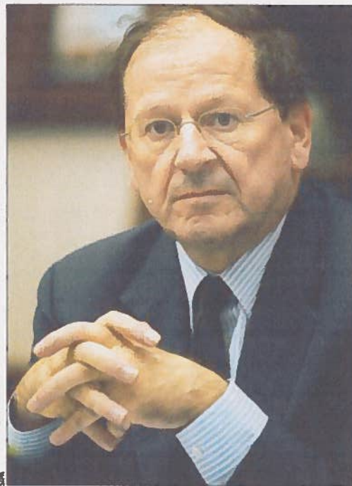
Hervé Novelli, ancien secrétaire d'Etat chargé du Commerce : "Le phénomène de l'auto-entrepreneur est massif. Si le régime a davantage attiré les hommes, il a séduit des porteurs de projets de tous âges, dans tous les territoires, et dans une grande variété de secteurs d'activité."

Une nouvelle figure de société est née. Il y avait l'ouvrier, le cadre moyen, le petit commerçant, il y a à présent, en plus, l'auto-entrepreneur. Au pluriel : ils sont déjà plus de 550 000 à avoir rejoint le nouveau groupe social que représente l'auto-entrepreneuriat. C'est plus qu'une étincelle : une belle flambée qui génère à la fois